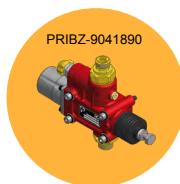
VÁLVULA DE SOBREPRESIÓN OVERPRESSURE VALVE VÁLVULA DE SOBREPRESSÃO