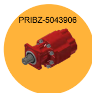
BOMBA HIDRÁULICA 100L 100L HYDRAULIC PUMP BOMBA HIDRÁULICA 100L