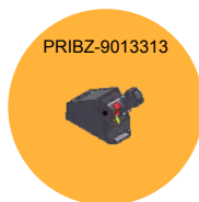
COMANDO POR JOYSTICK COMMAND BY JOYSTICK COMANDO POR JOYSTICK