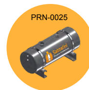
TANQUE 200L 200L TANK TANQUE 200L