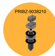
FILTRO DISTR. 150/180 L DISTR. FILTER 150/180 L FILTRO DISTR. 150/180 L