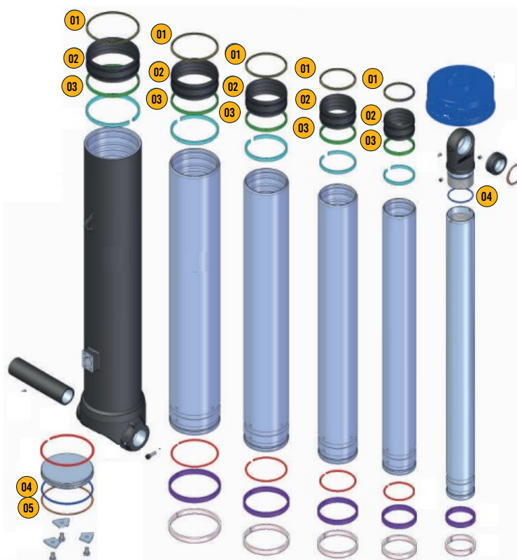
Tabla de Componentes